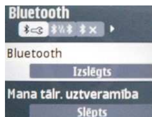
3.1. att. Bluetooth izslēgšana telefonā

Ja bluetooth neizmanto , tad vienkāršākais atslēdz to. Katram telefonam atslēgšana ir veicama citādāk, tāpēc, ja pašam nesanāk – palūdz kādam ģimenes loceklim vai draugam, vēl vienkāršāk ir palūgt to izdarīt veikalā, pērkot telefonu. Vai arī Tev pašam jāsameklē instrukcijā.